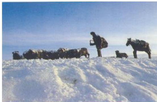
MONUMENTO AL OVEJERO - PUNTA ARENAS - CHILE